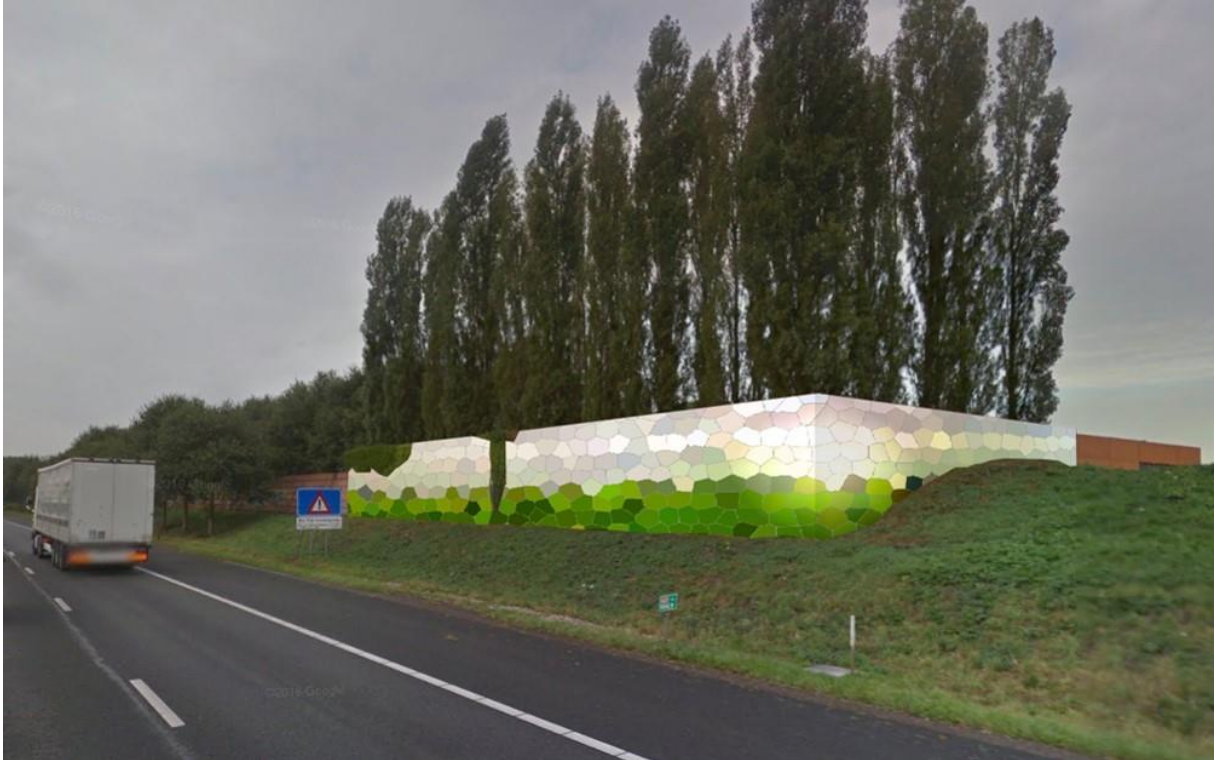
Afbeelding op het noordelijke bastion