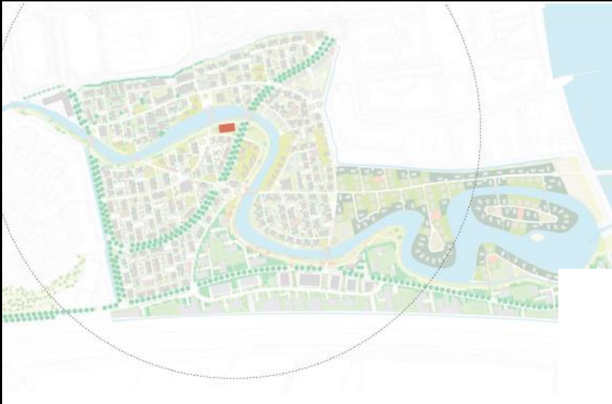
Trapveld voor de hele wijk